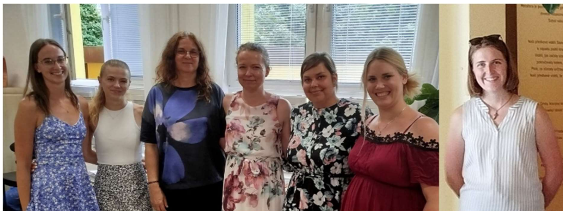
Tým služby sociální rehabilitace

Nakonec bychom chtěli poděkovat všem respondentům, kteří si na vyplnění dotazníku našli čas a poskytli nám zpětnou vazbu. Nesmírně si toho vážíme a těší nás, že v roce 2024 jsme v rámci naší služby podpořili 29 uživatelů, kterým bylo poskytnuto 1 119 hodin individuálních pracovních asistencí.