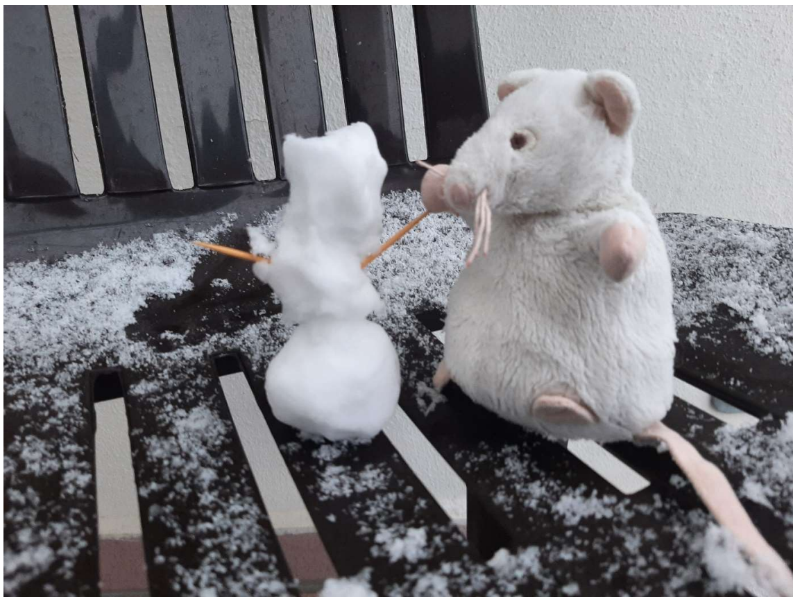
Sněhulák na balkóně!